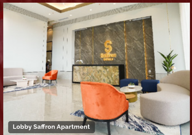
Lobby Saffron Apartment

Rasakan kemewahan dan kenyamanan tiada duanya di Saffron Apartment, hunian ideal untuk kehidupan prestisius Anda!